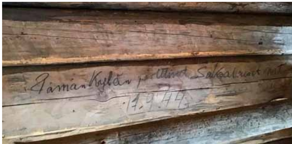
Suomalaisten pioneerien kirjoitus kylän polttamisesta 1944.