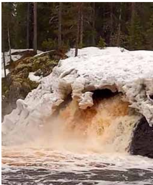
Komulanköngäs Hyrynsalmi.