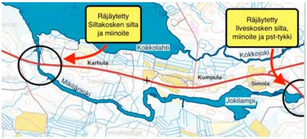
Saksalaisten joukkojen sijoittuminen Kypärävaaralla 1944.