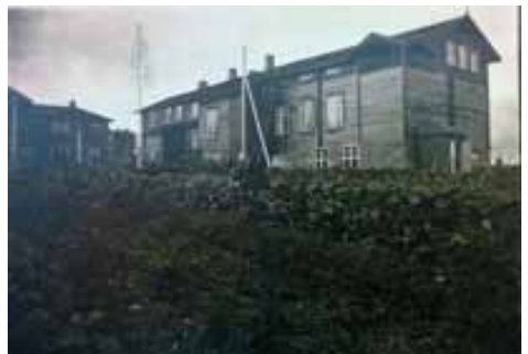
Kainuun Opisto 1920-luvulla